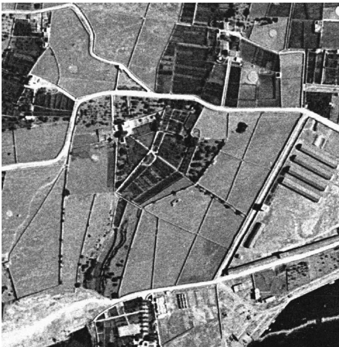
Fig. 24. Fotografia aèria de Sa Vinyeta (1956).