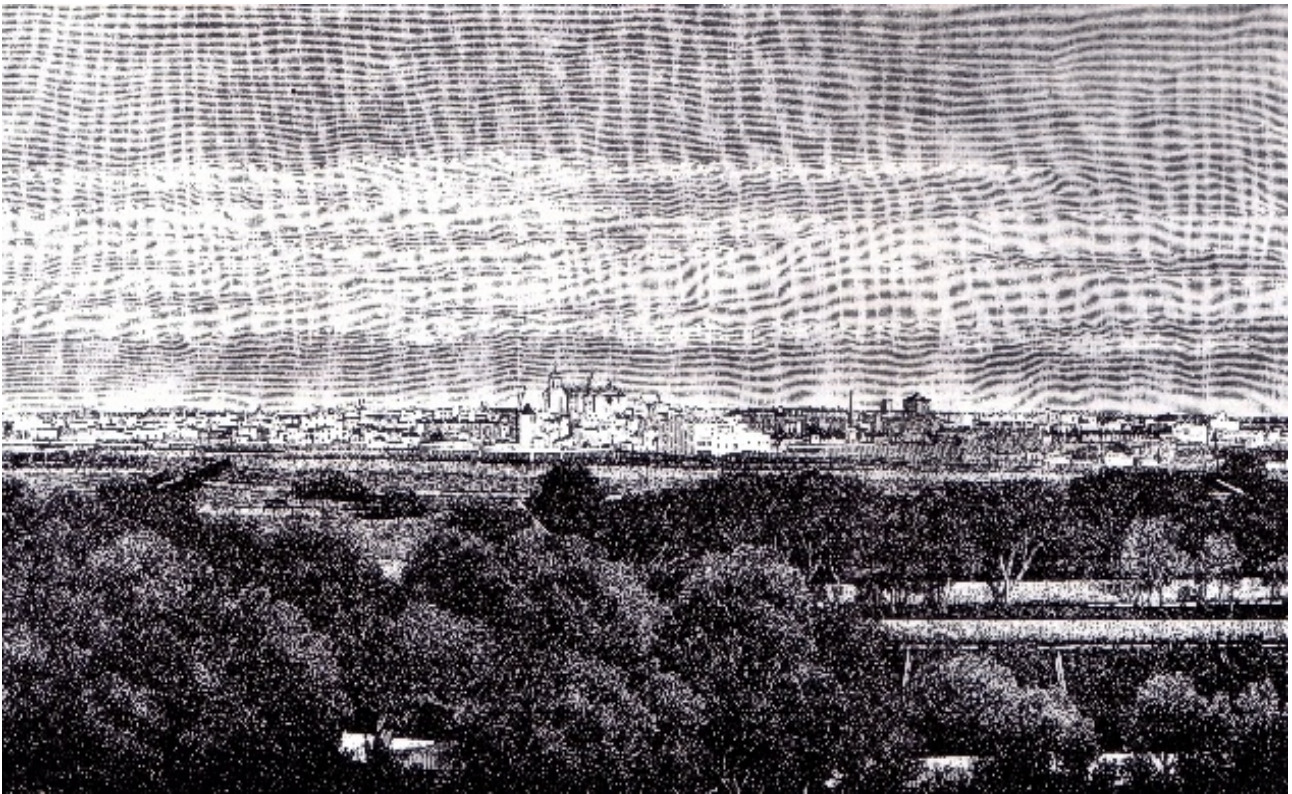
Fig. 11. Gravet amb una vista de Ciutadella des de la torre de Sa Vinyeta, de l'obra de l'Arxiduc Lluís Salvador d'Habsburg (1891).

Aquesta descripció ens deixa constància de que en molts pocs anys (entre l'amillament i la visita de l'Arxiduc, no més de 10 anys de diferència), a Sa Vinyeta s'hi introdueixen noves espècies de cultiu. Aquest fet, en part, es pot deure al retrocés que experimenta el cultiu de la vinya per la plaga de fil·loxera que assolà Menorca i la resta d'Espanya entre 1800 i 1833 i, en major mesura, a la demanda creixent de nous productes per part de la població urbana. Açò dóna lloc al progressiu increment del prestigi de la finca i, per tant, de la família propietària davant la població, que durà parell el seu embelliment i la incorporació progressiva de més espècies ornamentals i de fruiters.