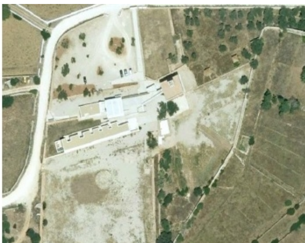
Fig. 27 i 28. Ortofotos de les cases de Sa Vinyeta després de les obres de l'alberg juvenil (esquerra) i en l'actualitat (dreta).