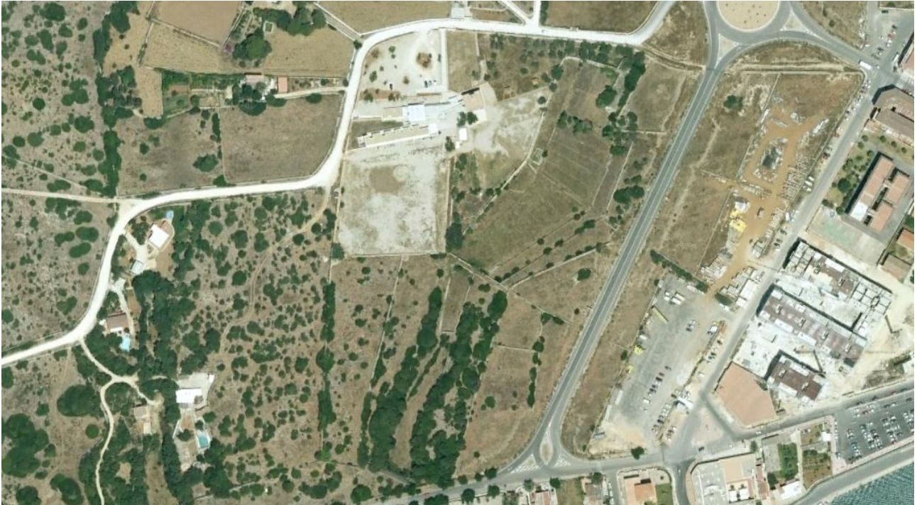
Fig. 29. Ortofoto per satèl·lit de Sa Vinyeta (2008).

paper de les diferents administracions implicades en la cessió, l'ús, la gestió i el finançament de l'alberg, s'arriba a un acord i l'Ajuntament de Ciutadella aprova un nou conveni en sessió de 10 de juny de 2010 i el Consell Insular de Menorca en sessió de 10 de maig del mateix any. El nou conveni entre l'Ajuntament de Ciutadella, el Govern de les Illes Balears i el Consell Insular de Menorca es signa definitivament el mes de novembre en data de 15 de setembre de 2010 56 i es presenta públicament als mitjans de comunicació el 17 de novembre de 2010.