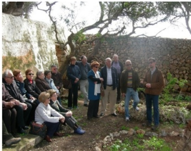
Fig. 32 i 33. L'equip Gibet durant les tasques de recuperació dels horts i jardins de Sa Vinyeta (esquerra). Visita divulgadora de les tasques de recuperació portades a terme per l'equip Gibet (dreta).