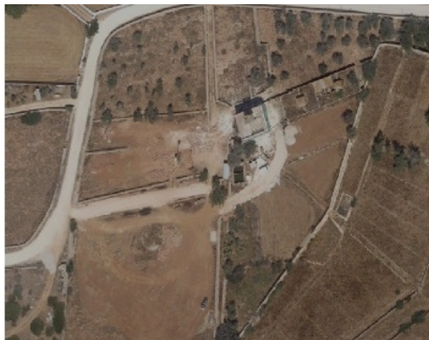
Fig. 25 i 26. Ortofotos de les cases de Sa Vinyeta abans (esquerra) i durant (dreta) les obres de l'alberg juvenil.