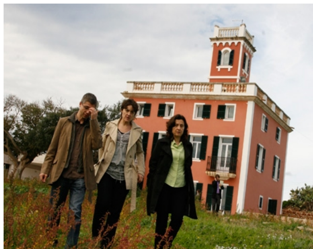
Fig. 30 i 31. Fotografia aèria de Sa Vinyeta en l'actualitat (esquerra). Fotografia de la presentació dels conveni de col·laboració entre les diferents administracions per a la gestió de l'alberg juvenil de Sa Vinyeta (dreta) (2010).