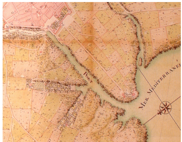
Fig. 3 i 4. Plànol de Ciutadella i rodalies (esquerra) i detall dels horts de cala en Busquets del mateix plànol (dreta) datat del 1758.