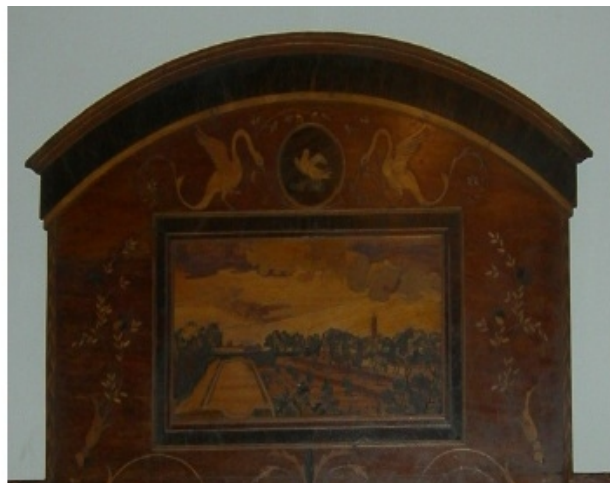
Fig. 12 i 13. Llit (esquerra) i detall de la capçalera (dreta) d'un dels dormitoris de ca n'Olives de "Davant l'Església", en el qual hi ha representat en marqueteria els horts i jardins de Sa Vinyeta.

A partir de la segona meitat de la dècada de 1940, el cultiu de blat en els sementers és substituït pel de farratge per al consum del reduït bestiar boví existent en el lloc. Els horts es segueixen cultivant amb fruiters i productes d'horta per al consum familiar, amb molt poc excedent per a la venda; i els "senyors" ja fa temps que no hi van a "fer s'estada", en benefici del seu més apreciat lloc de Ses Fonts Rodones, as Migjorn Gran. Els jardins romàntics de Sa Vinyeta, que són fruit d'una època ja passada, són gaudits pels propietaris en les seves esporàdiques visites a l'explotació i, malgrat que els mantenen com a zona d'esbarjo, la seva cura ja no és responsabilitat directa dels l'amos 36 .