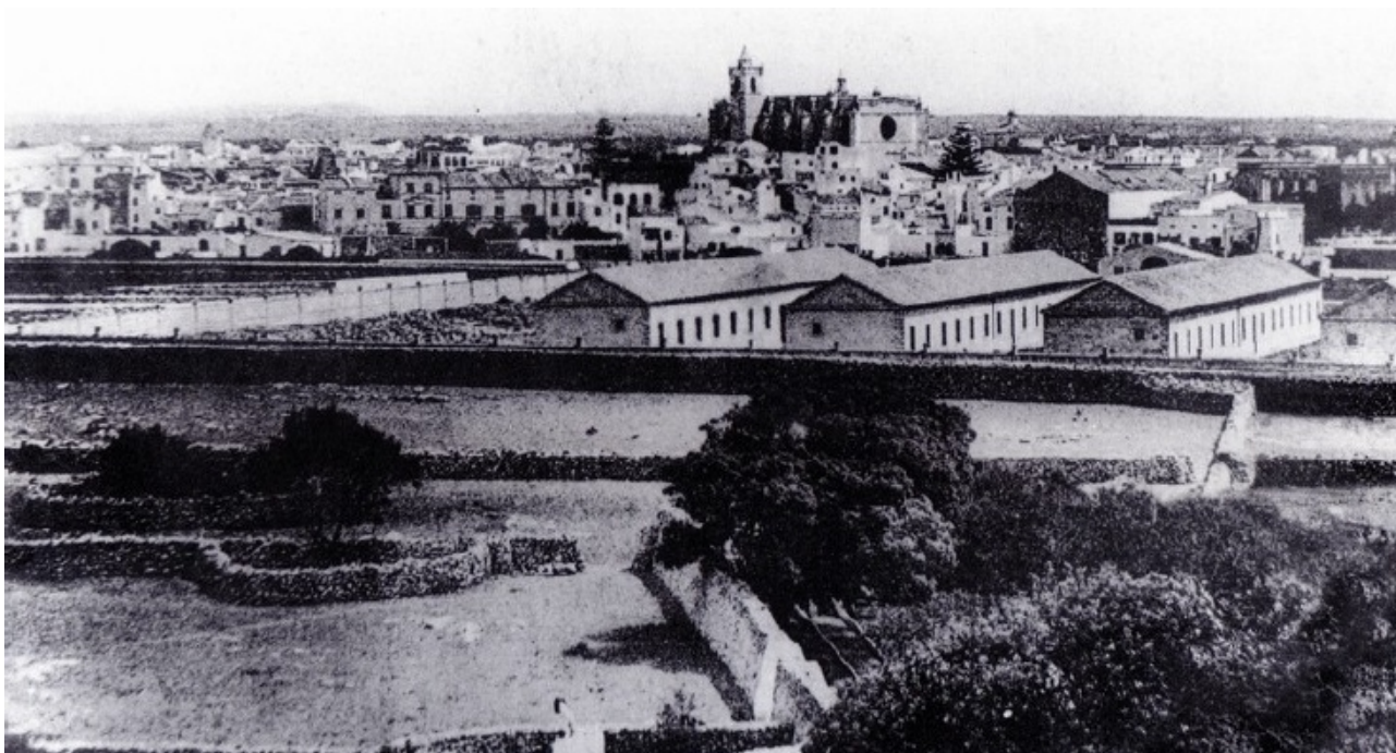
Fig. 16. Vista general de Ciutadella des de la torre del casat de Sa Vinyeta a principis del segle XX. En primer terme es veu la s'ina de l'hort i, al fons, els quarters d'Alfons XIII.

En els horts no hi ha un sol racó que no produeixi alguna cosa. En les veles més altes de l'hort principal hi ha nisprers, pruneres de diferents tipus i uns pocs tarongers; mentre que en la part més baixa hi ha filades de tot tipus de pereres i pomeres, a més de plataners i algun llimoner. A l'hort principal també s'hi sembra farratge, hortalisses (cols, lletugues, endívies, etc.), llegums (llenties, ciurons, faves, guixes, guixons, fesols, etc.) i tot tipus de tubercles (beta-raves, patates, monyacos, raveguins, etc.). A l'hort del canaló hi viuen algunes pereres, però és el lloc idoni per sembrar-hi certs productes d'estiu com síndries i melons i, com no, farratge pel bestiar. Al tram final del canaló, i fins a la mar, també s'hi sembra menjar per a les vaques. Cada dia es collen els fruits dels arbres de l'hort, i es duen a vendre al poble. Dues vegades a la setmana, "madona" s'atraca fins a la casa dels "senyors" per dur-los un paner ple de tot el que es produeix en el lloc.