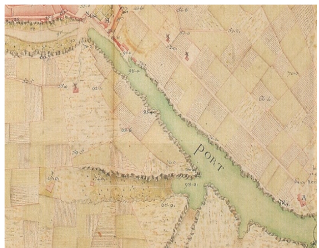
Fig. 5 i 6. Plànol de Ciutadella i rodalies (esquerra) i detall dels horts de cala en Busquets del mateix plànol (dreta) datat del 1762.