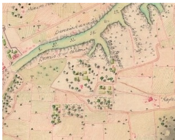
Fig. 7 i 8. Plànol de Ciutadella i rodalies (esquerra) i detall dels horts de cala en Busquets del mateix plànol (dreta) datat del 1782.

En el tercer plànol, signat per Blas Zapino l'any 1782 i elaborat durant la dominació espanyola del segle XVIII (1782-1798), es comença a intuir l'extensió del que esdevindria en el segle següent la propietat de Sa Vinyeta, que apareix representada com una zona d'arbres i d'horts situada dintre i als voltants del canaló de cala en Busquets i presidida per una edificació que es situa en l'indret de l'actual casat 28 . Com es veurà, entre aquest darrera plànol i el de Miguel Sorà de 1860, aquest paratge patirà una completa transformació tot adoptant els límits i la fisonomia que coneixem actualment de Sa Vinyeta i del seu hort.