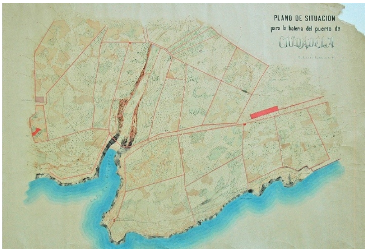
Fig. 23. Plànol d'una part de la finca de Sa Vinyeta i de les rodalies de cala en Busquets per a la instal·lació d'una bateria militar poc abans de la Guerra Civil espanyola de 1936-1939.

A l'any 1970, a Sa Vinyeta ja no hi viu ningú 37 , i roman abandonada durant alguns anys més.