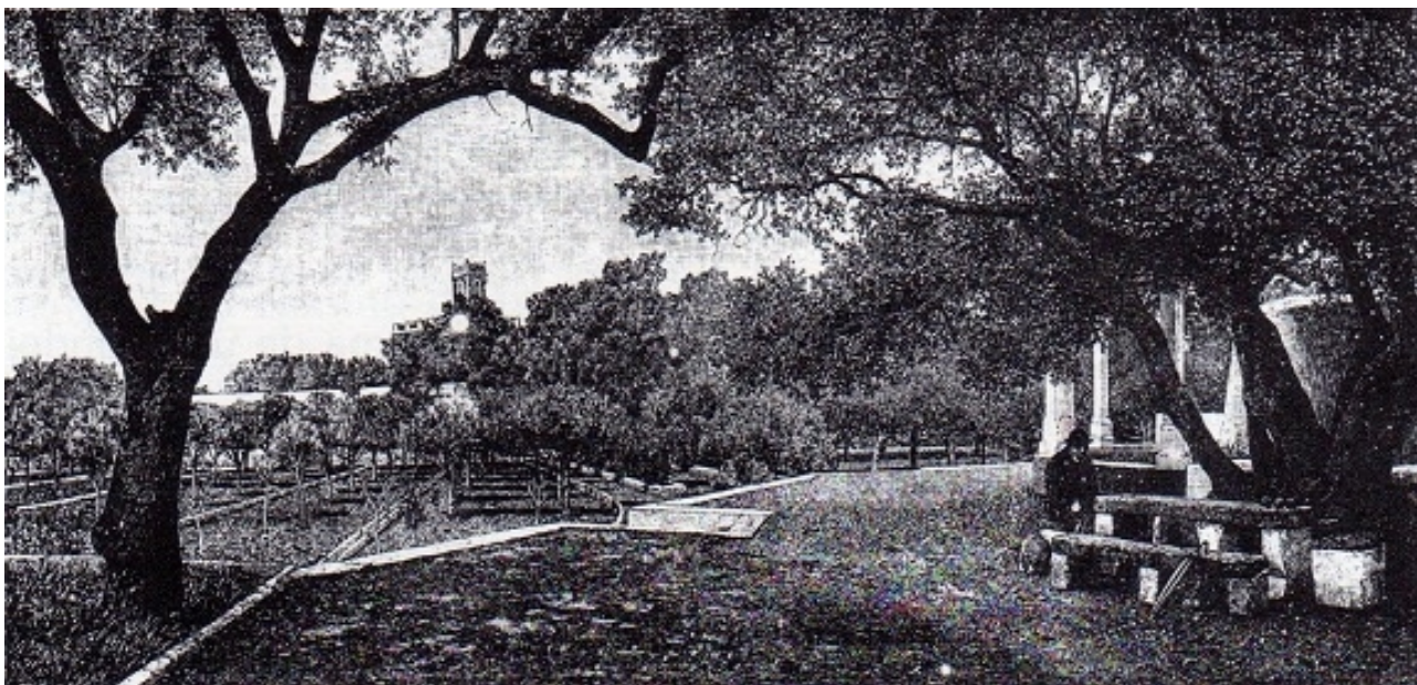
Fig. 10. Gravat dels horts i jardins de Sa Vinyeta de l'obra de l'Arxiduc Lluís Salvador d'Habsburg (1891).