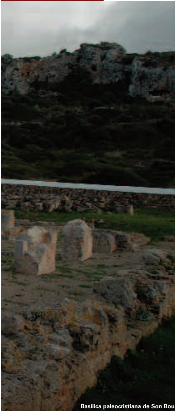
Basilica paleocristiana de Son Bou

Quien solo conoce Menorca por sus playas se está perdiendo lo mejor de la isla: un museo cuyas primeras "piezas" se registraron hace más de tres mil años y que sigue incorporando nuevos tesoros a su patrimonio. En su defensa y difusión, se embarcó hace años un grupo de ciudadanos –término que, en la cuarta acepción del Diccionario, significa "hombres buenos"–, que anualmente organiza unas jornadas para presentar la riqueza arqueológica isleña.