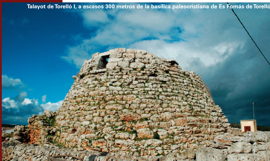
Talayot de Torelló I, a escasos 300 metros de la basílica paleocristiana de Es Fornàs de Torelló

Tenemos la suerte de que este hallazgo, tan ligado a la postre a la historia menorquina, está recogido en primera persona por el presbítero que localizó las reliquias, siempre con la ayuda de Gamaliel, una aparición que le indicó el lugar exacto donde estaban. Cuando las autoridades se acercaron a la tumba del protomártir, tembló la tierra y una fragancia maravillosa y curativa –los afortunados que la olieron recuperaron súbitamente la salud– se expandió por la tierra. Cerra- >